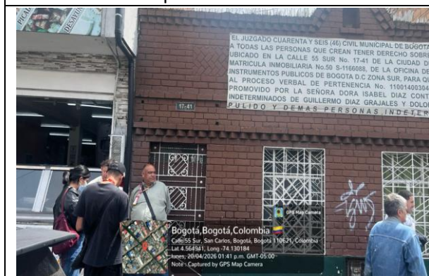
Fotografía 3. Visita no atendida en la presunta bodega de reciclaje Asociación de Recicladores Madereros de Colombia.