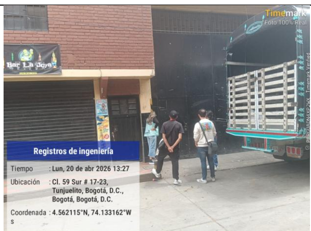
Fotografía 2. Visita no atendida en la bodega de reciclaje RhemaColeca