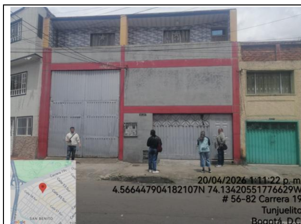
Fotografía 1. Visita no atendida en la bodega privada ARBUI